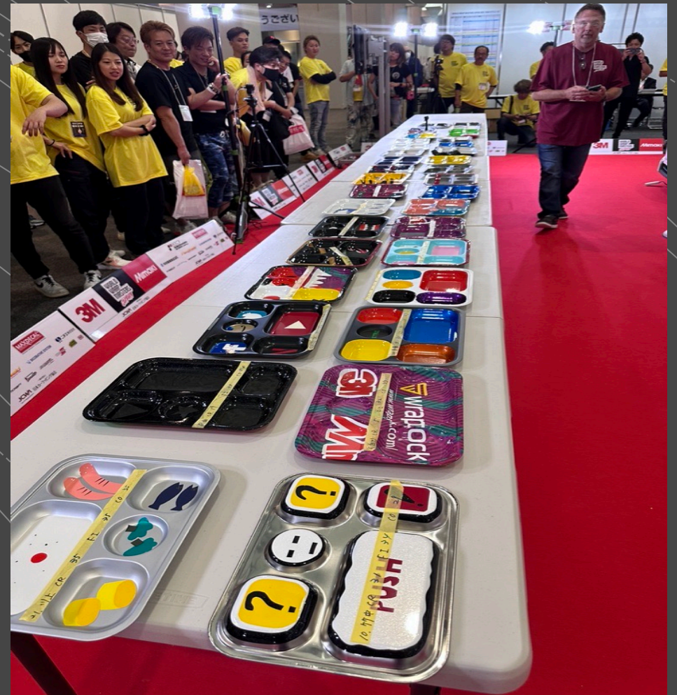
クリエイティブラッピング